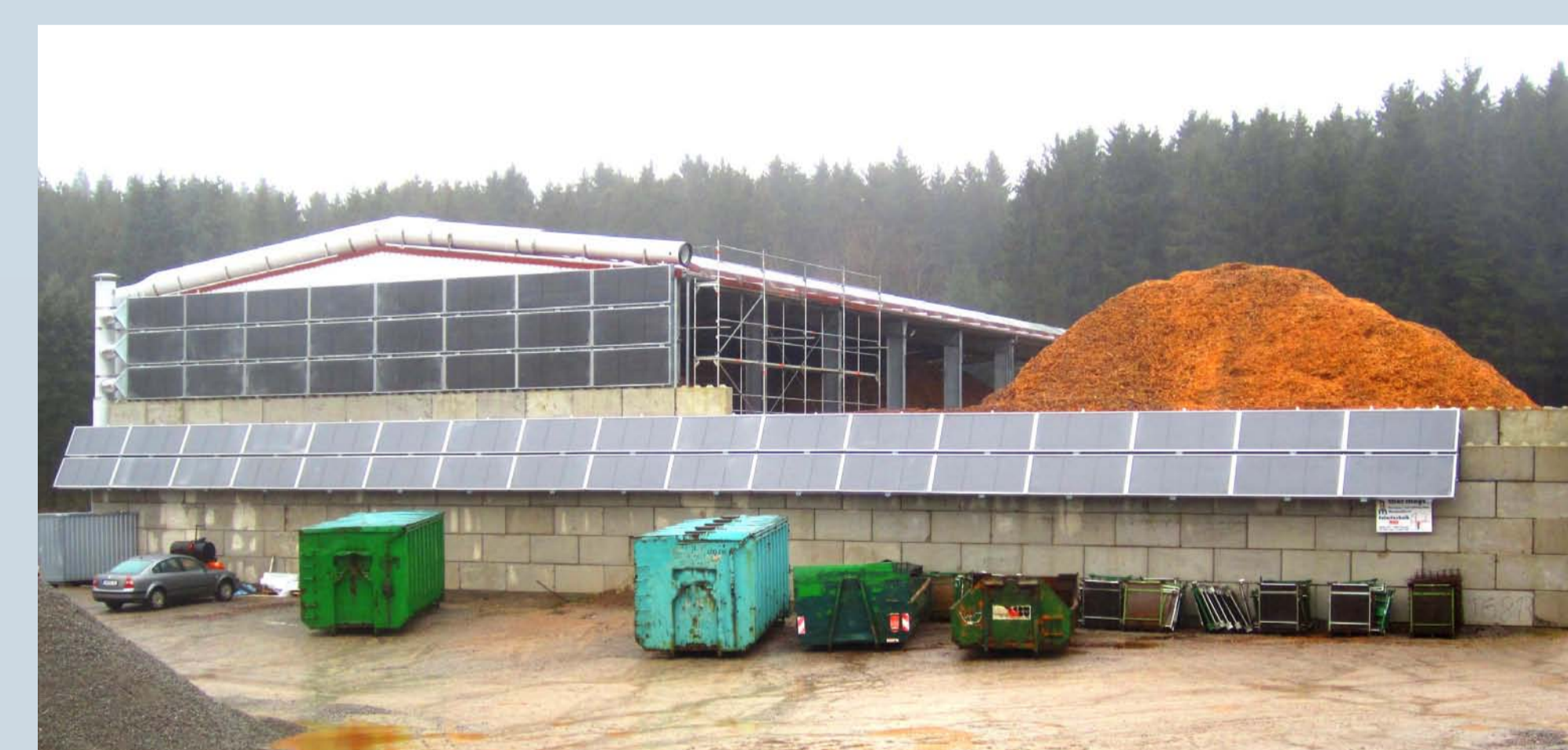
Odenwald, Deutschland: Die mit 507m 2 weltweit größte* solare Prozesswärmeanlage zur Trocknung von Holzhackschnitzeln = geprüfte Qualität vom Weltmarktführer GRAMMER Solar! * (Stand 1/2015)