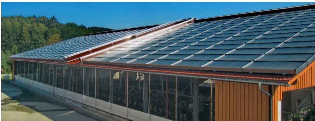
1300 m 2 Luftkollektoren auf einem Rinderstall erzeugen Wärme zur Trocknung von Heu- und Hackschnitzeln. Hier sieht man nur die Westhälfte der Anlage.